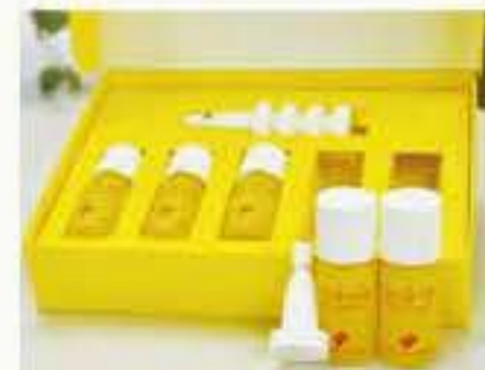
ビザビ イフェクティブエッセンスC

ビザビシリーズのスキンケアは、夏の紫外線で傷ついた細胞一つひとつを修復しながら、ダメージをお肌に残さず潤いのあるキメの整った素肌美を作り上げます。