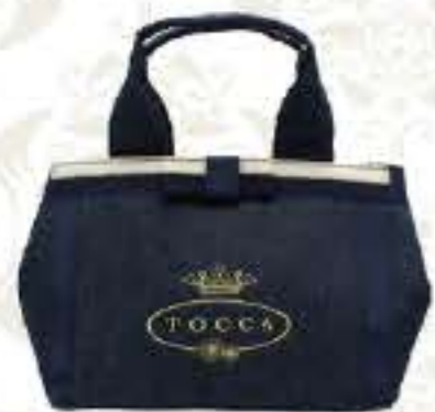
CHELSEA BAG [SMALL トートバッグ]